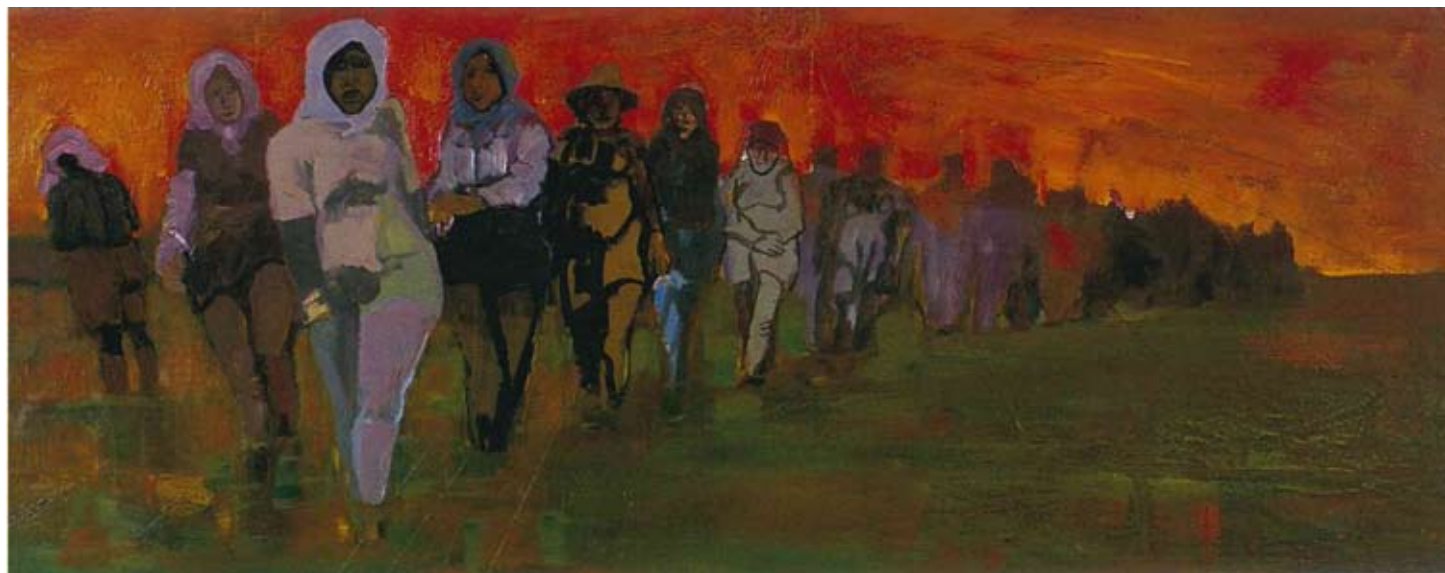
Mondine a Buda di Medicina, 1957, olio su faesite, Parma CSAC

Al termine del convegno, alle ore 19, negli spazi della Raccolta Lercaro (via Riva di Reno, 57) si inaugura la mostra "Aldo Borgonzoni. Immagini e visioni dal Concilio Vaticano II" (12 ottobre 2013 – 12 gennaio 2014)